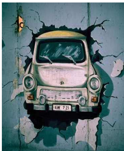
So kann man es auch sehen – entdeckt an der East-Side-Gallery

Wie wohl kein anderer Tag umreißt der 9. November Höhen und Tiefen preußisch-deutscher Geschichte. Er weckt Freude und Stolz, Nachdenklichkeit und Besinnung sowie Zorn und Schamgefühl. Der Zufall legte Eckdaten deutscher Geschichte zusammen: die unblutige Revolution mit dem Fall der Mauer vor zwanzig Jahren als markanten Wendepunkt in der Nachkriegsgeschichte, den klirrenden Pogrom vor 71 Jahren gegen deutsche Staatsbürger jüdischen Glaubens, dem der Marsch Hitlers am 9. November 1923 zur Feldherrenhalle in München voranging, und die blutige Revolution von 1918 mit dem Ausrufen der Republik und dem Ende der vielhundertjährigen Herrschaft der Hohenzollern.